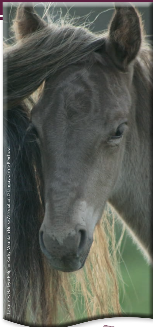
La Cense's Harley® Belgian Rocky Mountain Horse Association

(conférence, syllabus, collation) : 12 € par conférence à verser sur le compte BE80 0013 8670 0377 au nom de la CWBC, au plus tard 8 jours avant la conférence, en indiquant en communication : nom + prénom + date(s) choisie(s)